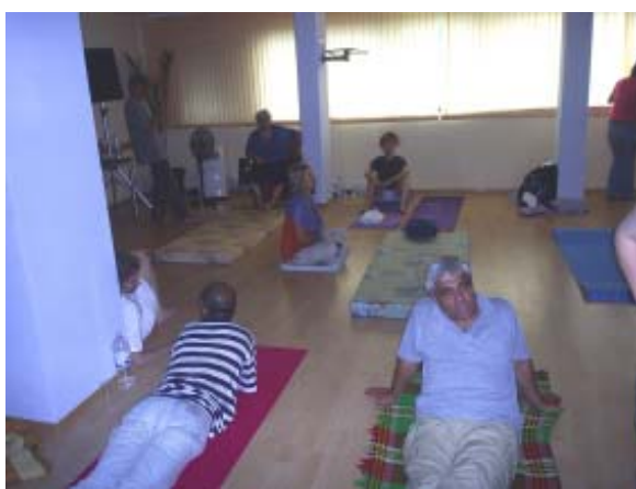
атмосферата преди холотропен сеанс

на сеансите се обработва огромно количество психичен материал - да ме извини читателят за жаргона! - разтоварват се негативни емоции, свалят се хронично активизиращи се напрежения и тревожност. Често се преживява и така наречения "инсайт" – внезапен проблясък или внезапно откровение относно решението на трудни задачи или объркани взаимоотношения, в които човек винаги се заплита уж случайно, но пък като по часовник, дори се свалят наднормени килограми. Изобщо, тези часове в една свръхнатоварена психотерапевтична реалност са чудесна възможност да се надникне през заешката дупка и да се опознае част от страната на чудесата.