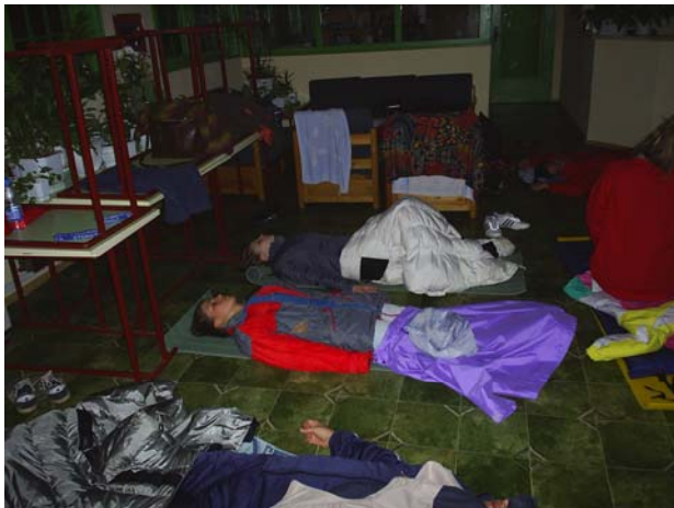
По време на холотропен сеанс

Разбира се, пневмокатарзисът не е панацея – като всяка технология и той си има ограничения. Но може да подпомогне страхотно терапията на ред заболявания. А за така наречените „здрави“ хора може да изиграе роля на мощно преве-